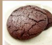
ブラウニークッキー 200円