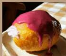
ブルーベリーチーズケーキ 500円