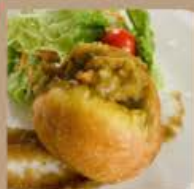
カリビアンチキンカレーバン 550円