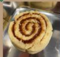
シナモンロール 200円