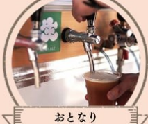
おとなり オリジナルクラフトビール