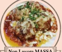
Non Lavora MASSA イタリア風肉団子のピザ職人風。 アサリと大葉のシメベテリ、ムンベネ、 自家製鶏レバーのムース、自家製レモネード等