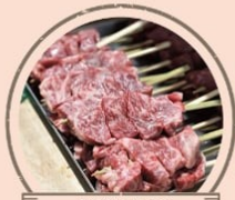
磐梯2号店 ステーキ弁当、牛串