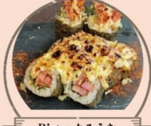
Bistroぐるうむ 自家製ベーコンと CHEDDARチーズのロール寿司