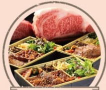
シンラガーデン A5黒毛和牛スペシャル弁当