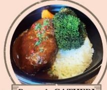
Brasserie CATHERINE 煮込みハンバーグ、ギッシュム、 ドリンクなど