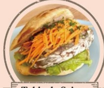
Table de Saison 川越三元豚のハテサンド、オニオングラタン 風スープ、プリン、焼き菓子、ワイン各種