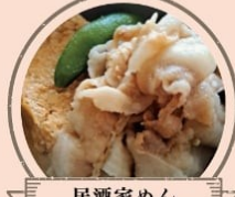
居酒屋めん 川越内豆腐(小江戸黒豚・佃煮豆腐・小野農園 野菜・まごころファーム川越肉厚しいたけ)