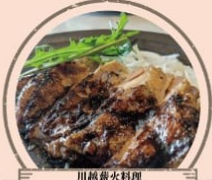
川越薪火料理 in the park 薪火焼きのチキン・ブーク・ビーフ料理