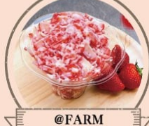
@FARM 削りいちご、ポップコーン