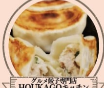
グルメ餃子専門店 HOUKAGOキッチン 肉汁鶏餃子、肉汁彈羅焼き小籠包