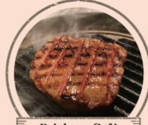
Brighton Café 名物ねぎ塩牛タン焼き、名物牛タン、 カルビ焼き、特大牛カルビ串