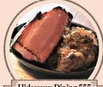
Hideaway Dining 555 黒毛和牛のローストビーフ、河越麦酒、ハラミス ステーキ、555ソーセージ、和牛ローストビーフ丼、 ハラミスステーキ丼、合盛り丼、肉盛り合わせ