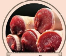
otto e Co. 鹿と猪のフランクフルトなど