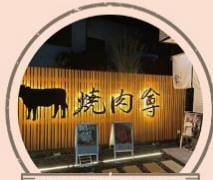
個室焼肉 本川越 尊 A5和牛炭火焼き弁当2種 ※目の前でお焼き致します。