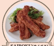
SAIBOKU(サイボク) 骨付きベーコン、ウインナーカップ、 サイボク×コエドコラボレーションビール