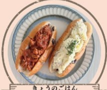
きょうのごはん ゆるりCafé コッペイ赤・コッペイ白 国産牛のトマト煮込コッペイパン アクセントがきいたポテトサラダパン など