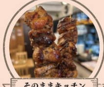
そのままキッチン 日本人好みのジャークチキン