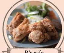
R's cafe ハワイアンモチチキン