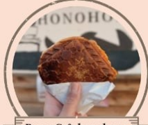
BurgerCafe honohono ホットサンドバーガー