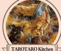
TAROTARO Kitchen 牛めし、鶏手羽先唐揚げ