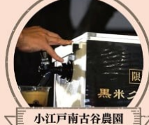
小江戸南古谷農園 黒米おにぎり、黒米ビール、真蔬菜など