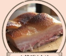
お結びはたけ 塩麹漬自家製ベーコン、 青唐辛子やハラペーニョのおむすびなど