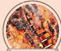
ミオ・カザロ 骨付きスペアリブ