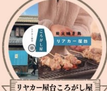
リヤカー屋台ころがし屋 炭火やきとり