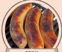
FICO サルシッチャ 骨付きスペアリブ、パルサミコ煮込み