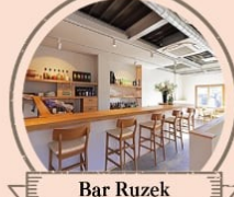
Bar Ruzek コエドビール、ハイボール各種、 ノンアルコールカクテル