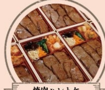
焼肉ハレトケ 上州和牛を使用した 特製ハレトケ弁当、食比べ丼など