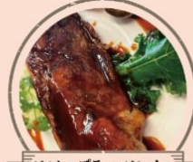
ビストロプティ・ソレイユ 骨付きスペアリブ、ホータクフランク、 自家製プリン