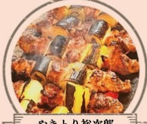
やきとり裕次郎 やきとり、もつ煮、無限なんこつ アルコール、ソフトドリンク