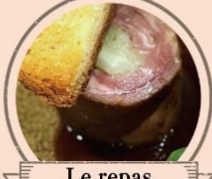
Le repas 牛フィレ肉のポビーエット