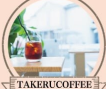
TAKERUCOFFEE お肉料理とペアリングする特別な スペシャルティコーヒー