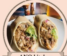
ANO kitchen チキンティンガタコス、ビーフバルブッコアタ コス、ホークカルニタスタコスやアルコール類