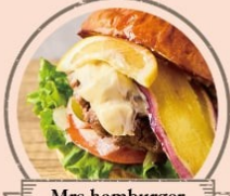
Mrs.hamburger 武州和牛使用特製ハンバーガー& スライダーバーガー