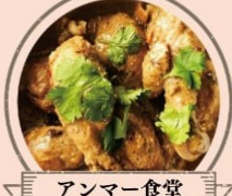
アンマー食堂 南インドカレー、チティナードチキン