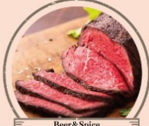
Beer&Spice PUB Liberty 特製ローストビーフ 肉フェス限定よだれ鶏