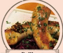
Bellknot 当日限定メニュー エーデルピルス(生ビール)、ワイン