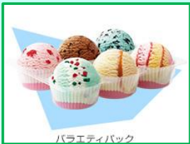
バラエティパック